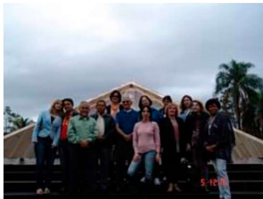
Parte do grupo presente no Festival de Jaguará