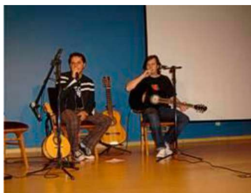
Componentes da Banda Outubro