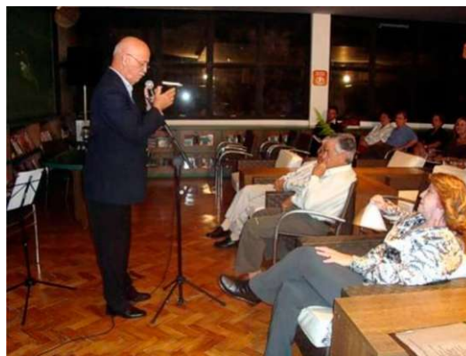
Apresentação de João Gilberto.