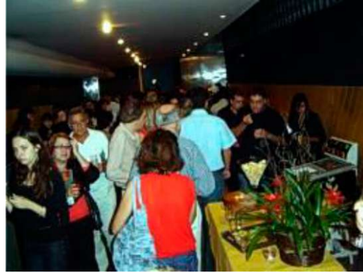
Momento de confraternização